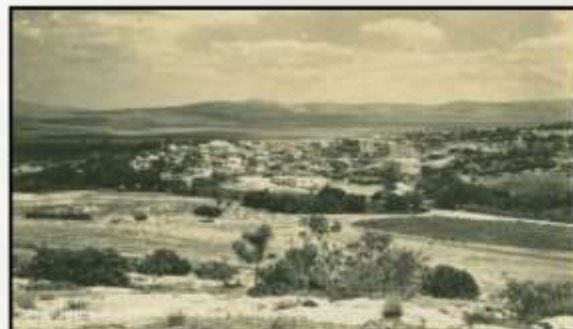
صورة مركز جنين - 1918