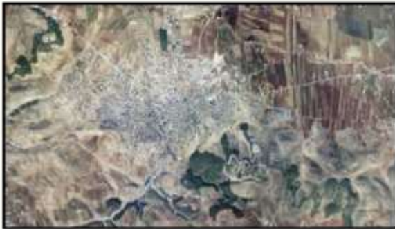
صورة جوية - جنين - 2002