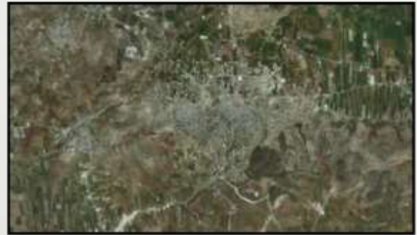
صورة جوية - جنين - 2012