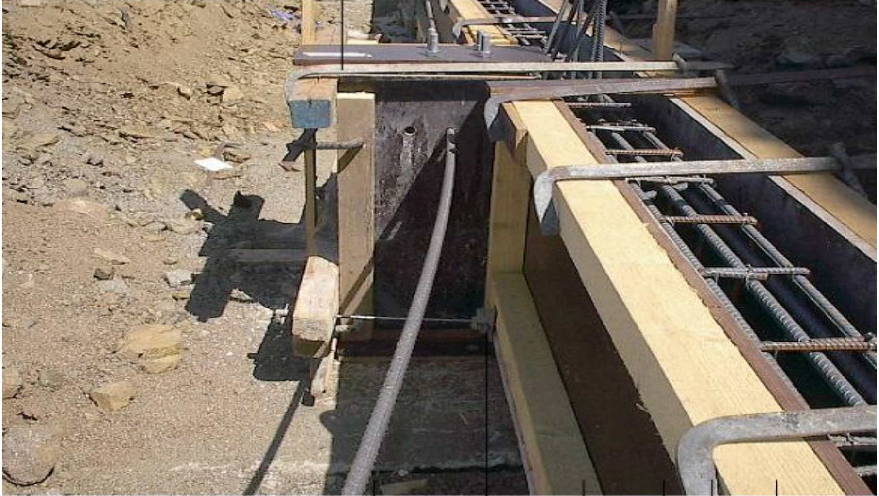
تشبيد مباني 3