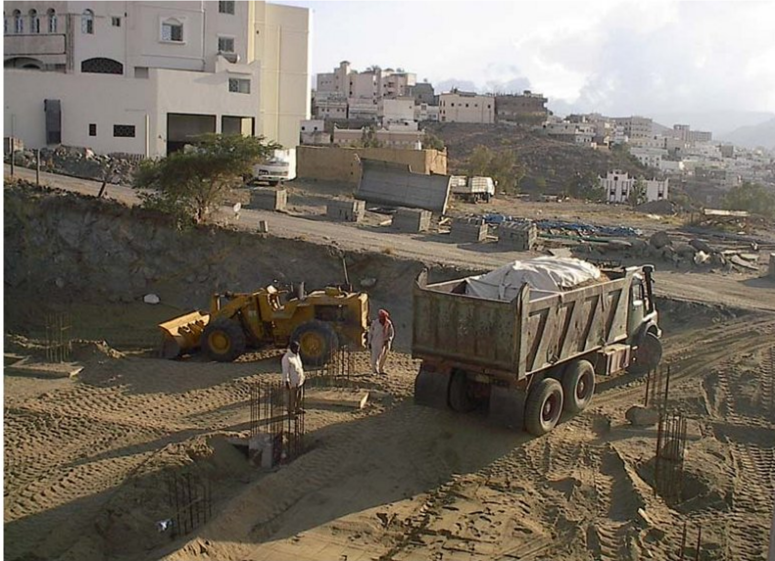
شكل رقم (٨) أعمال الحفر والردم في أحد المشروعات